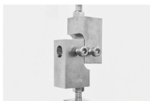
涂层剪切疲劳测试