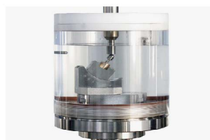
牙种植体动态疲劳测试