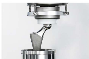
股骨柄疲劳性能测试