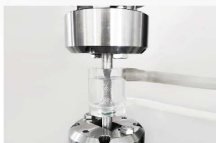
镁合金腐蚀疲劳测试