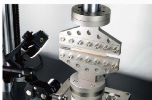
橡胶片材裂纹扩展测试