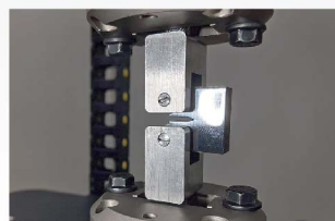
金属疲劳裂纹扩展测试